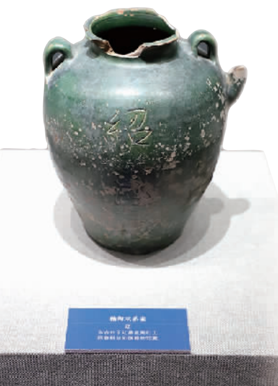
■追缴和抢救性考古发掘出土的文物珍品。