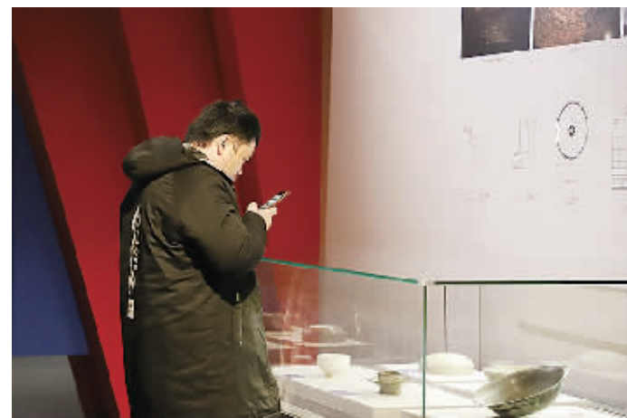
■市民驻足参观展览。