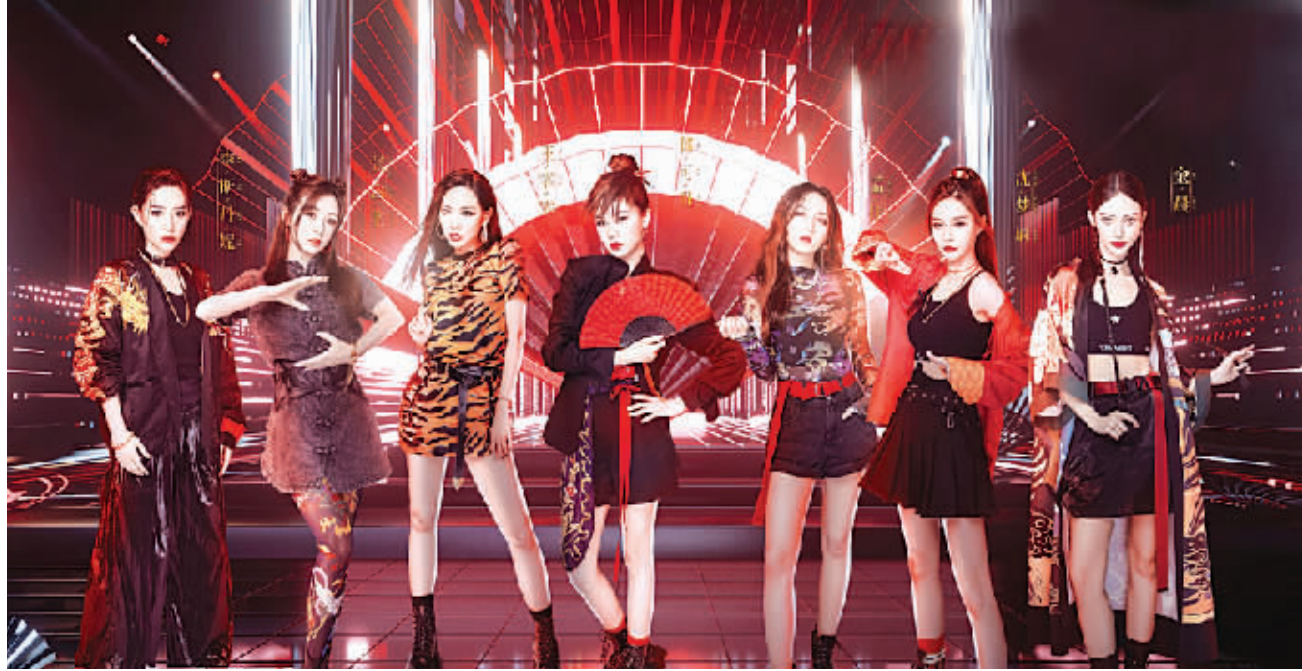
◆“大碗宽面”组已是成熟的“女团”组合