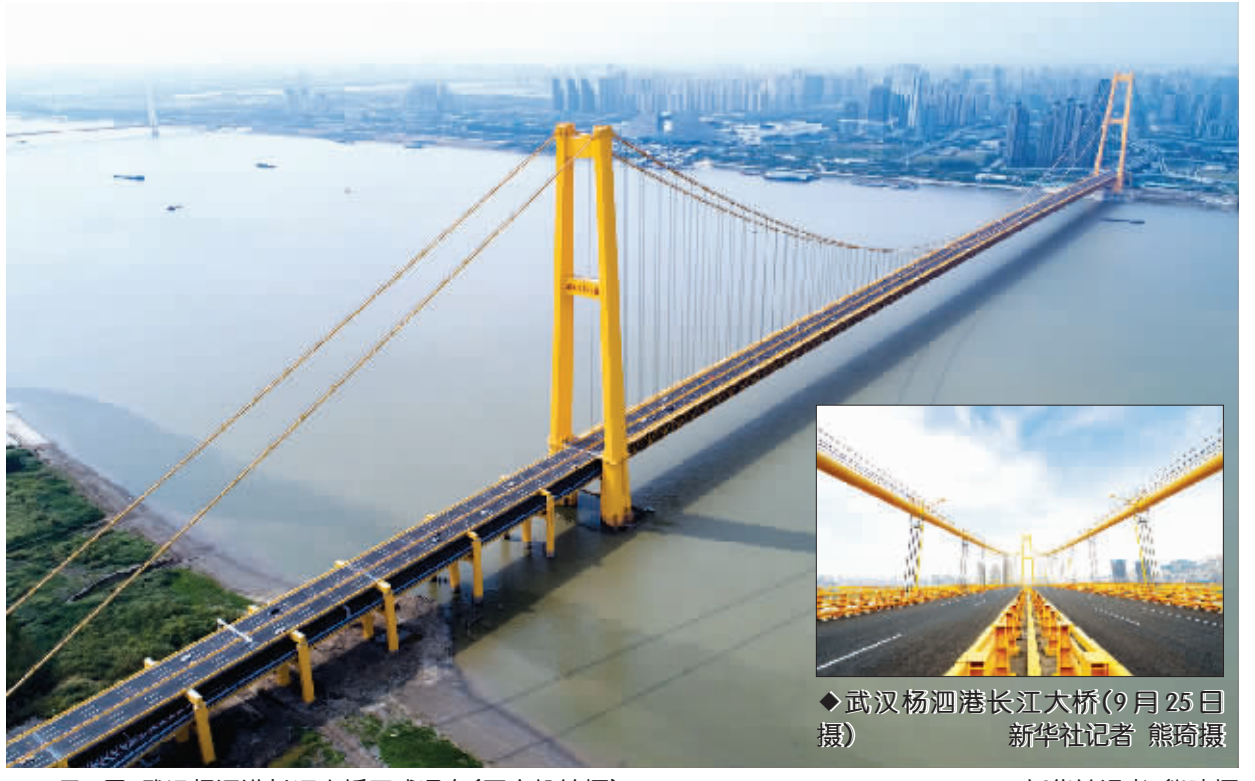
◆10月8日,武汉杨泗港长江大桥正式通车(无人机拍摄)