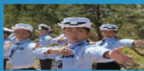
晨报小记者采访活动照片