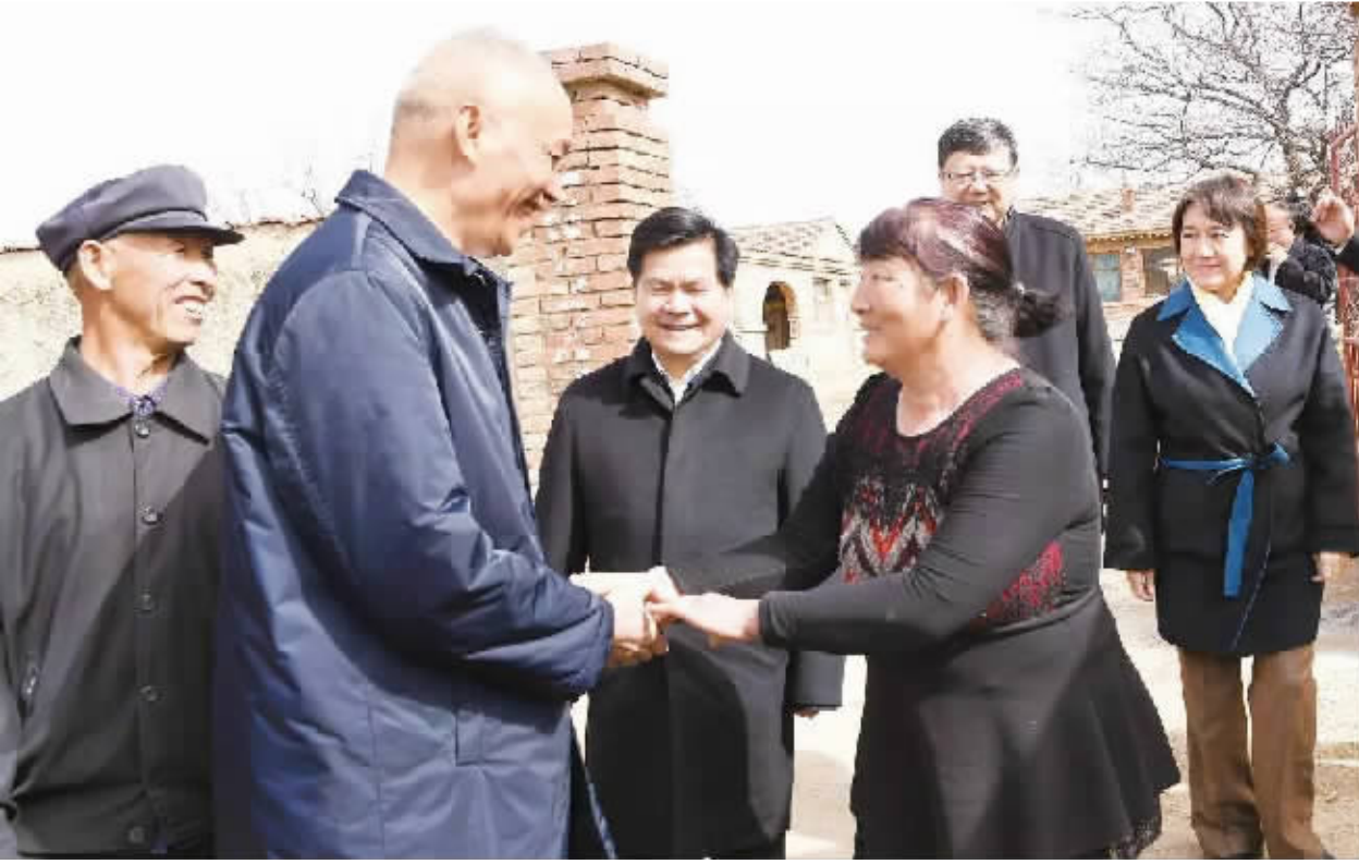
■4月9日,在自治区党委书记、人大常委会主任李纪恒,自治区党委副书记、自治区主席布小林的陪同下,中共中央政治局委员、北京市委书记蔡奇(左二),北京市委副书记、市长陈吉宁(右二),到兴和县南三号自然村贫困户刘玉宝家中走访慰问。

为深入贯彻党中央关于打好精准脱贫攻坚战的重大决策部署,8日至10日,北京市党政代表团来我区,就扶贫协作工作进行沟通对接,并签署全面深化北京内蒙古扶贫协作三年行动框架协议。中共中央政治局委员、北京市委书记蔡奇,北京市委副书记、市长陈吉宁与自治区领导李纪恒、布小林、李佳等座谈。座谈会上,陈吉宁、布小林分别介绍了两地经济社会发展及扶贫协作工作。