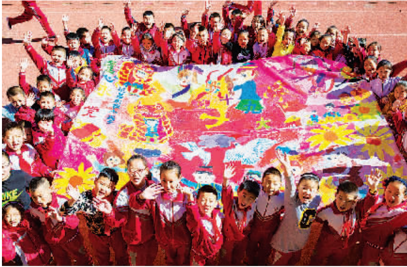
全媒体记者 王乐 通讯员 丁根厚摄影报道

“我爱祖国,希望我们的社会更和谐更美好!”“我要好好学习,长大了为家乡作贡献!”这些稚嫩的话语、殷切的期盼来自呼市玉泉区恒昌店巷小学的孩子们。11日,玉泉区恒昌店巷小学举行“童心向党 领巾飞扬”主题教育活动。在现场,学生们通过表演歌舞、朗诵诗文、绘制主题画等形式,表达着对党的十九大召开的激动之情和国家繁荣昌盛的美好祝愿。