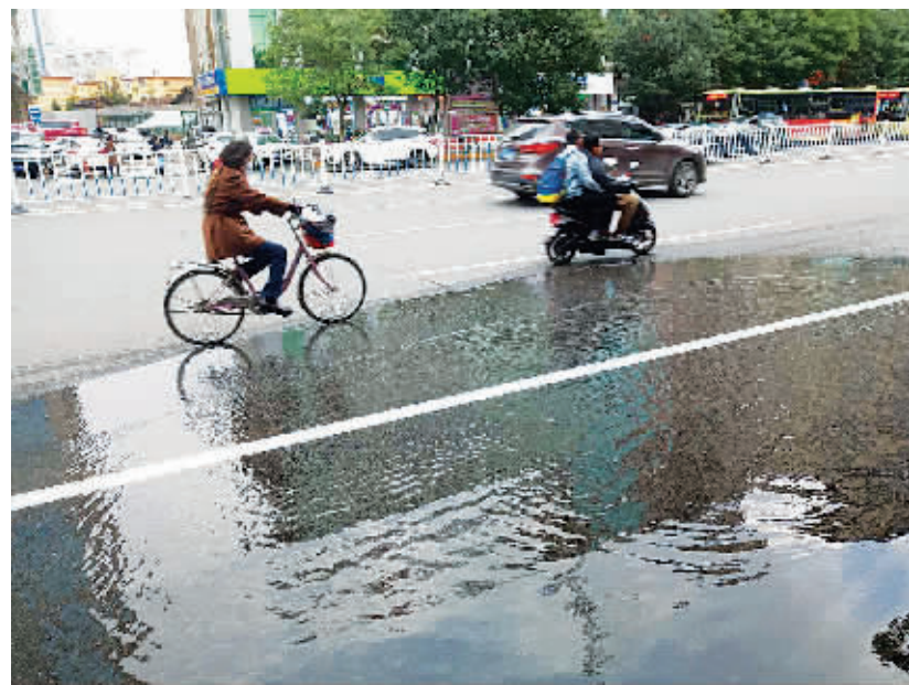
◆路过的市民纷纷绕行