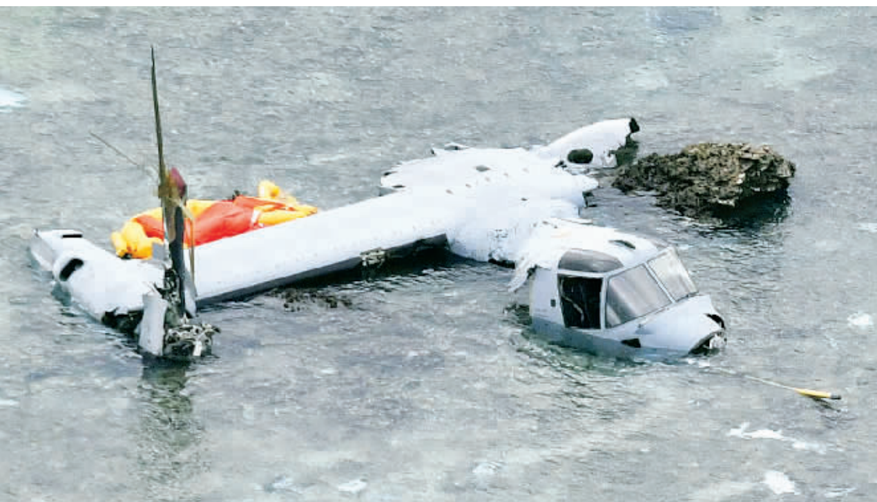
◆2016年12月14日,在日本冲绳附近海域拍摄的迫降的驻日美军MV-22“鱼鹰”倾转旋翼机残骸

日本防卫省消息人士9日说,驻日美军不顾日本政府的反对,已经连续两天在日本境内飞行“鱼鹰”运输机。