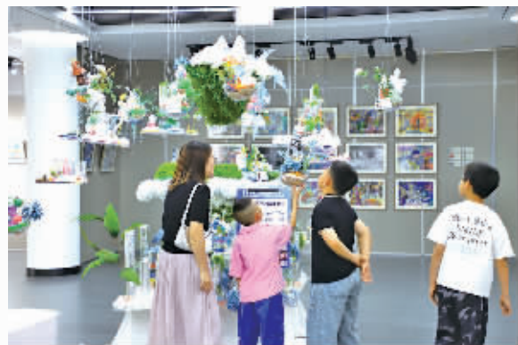
◆家长带孩子观看展品《浮空岛计划》。