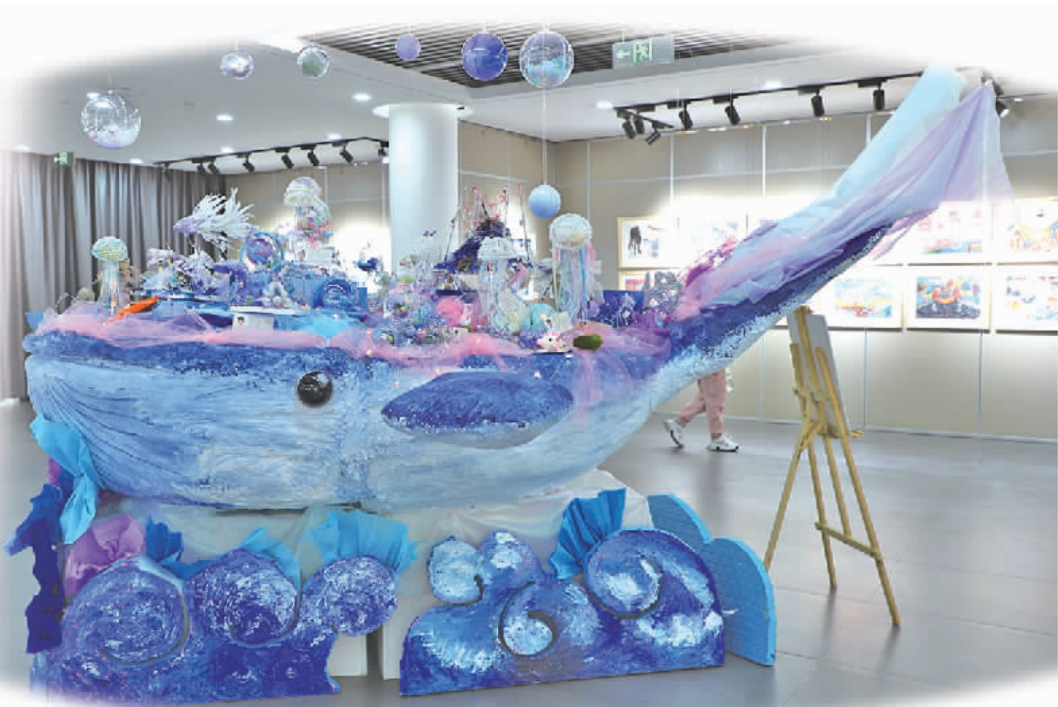
◆展出的作品《未来海洋—无尽畅游》。