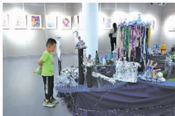
◆小朋友在观看展品《未来生活场景—城市、海洋、植物》。