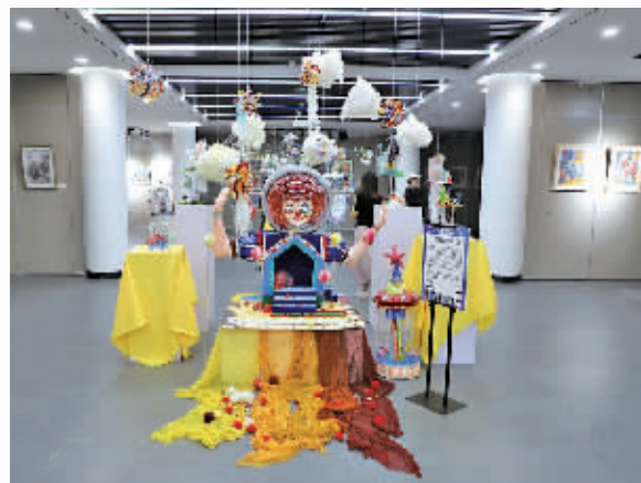
◆作品《重启乐园计划》。