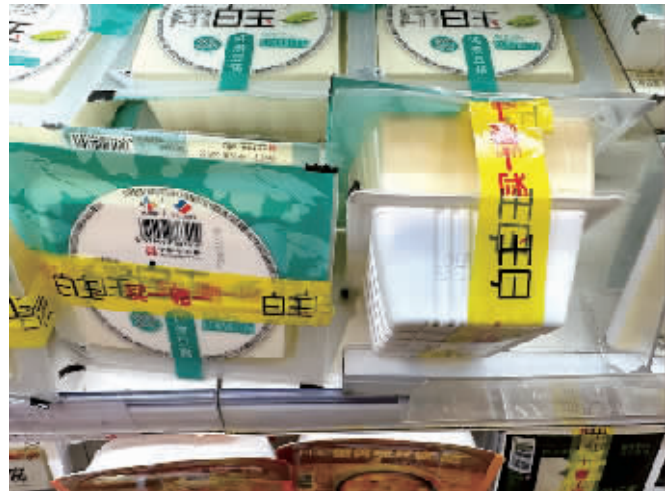
◆两盒豆腐捆绑销售,不透明胶带正好把下面一盒豆腐包装上的生产日期遮挡住了。