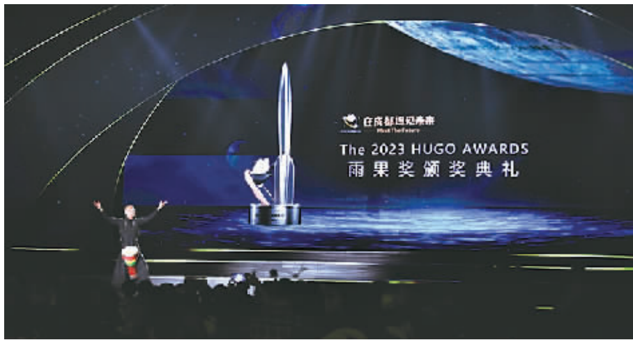
◆这是10月21日在成都拍摄的2023雨果奖颁奖典礼现场。

所颁发的年度奖项。该奖项设立于1953年。值得一提的是,本届雨果奖也是自该奖项设立以来非英语会员参与人数最多的一次雨果奖评选。 据新华社报道